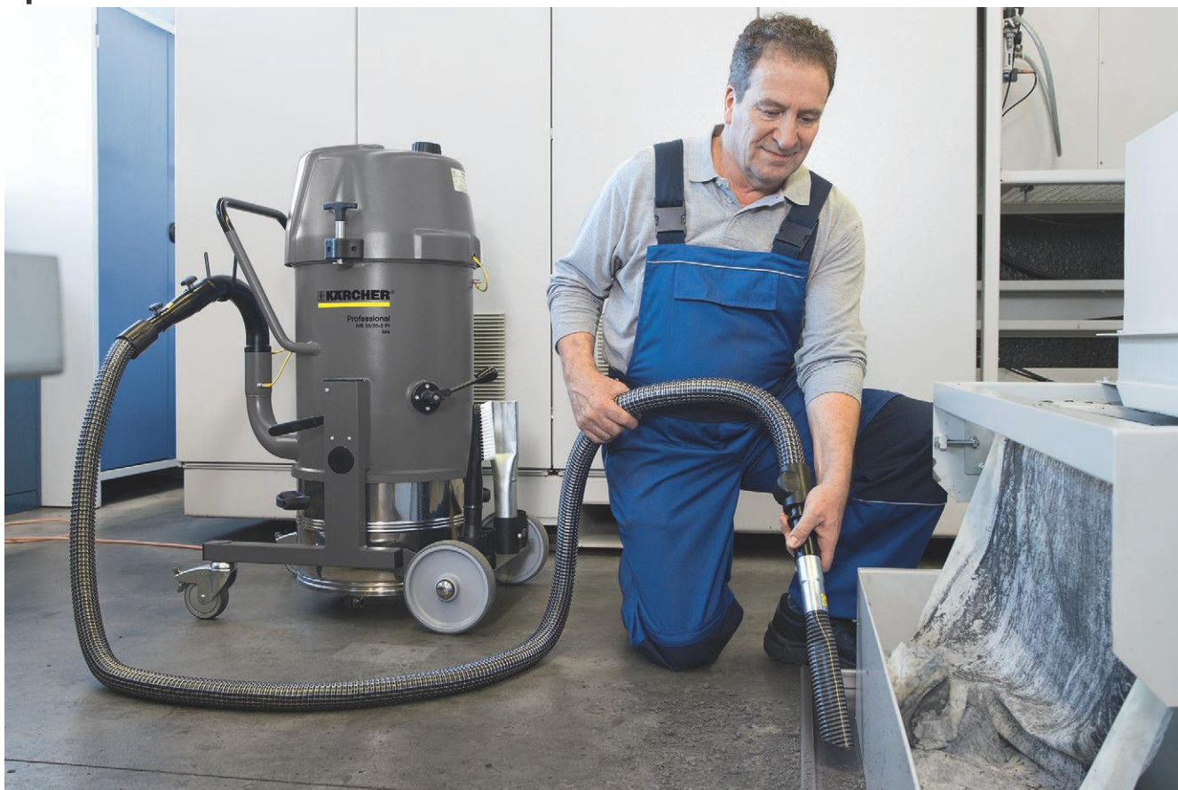
IVR 35/20-2 Pf Me