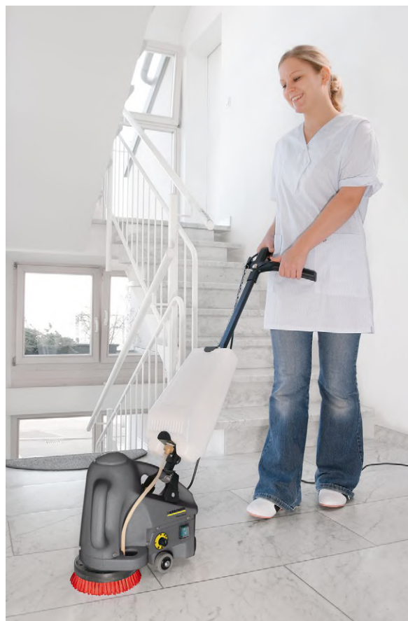
BD 17/5 C