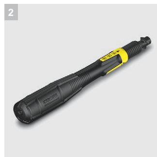
2 Струйная трубка 3-в-1