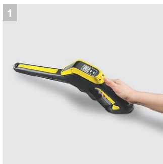
1 Пистолет высокого давления Full Control Plus