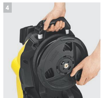
4 Барабан для шланга