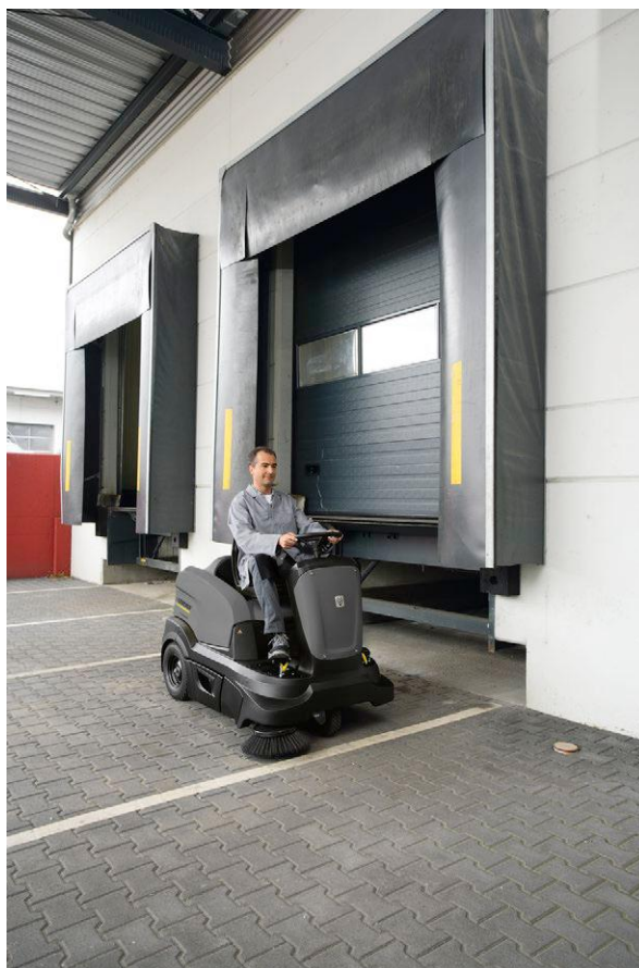
KM 90/60 R G